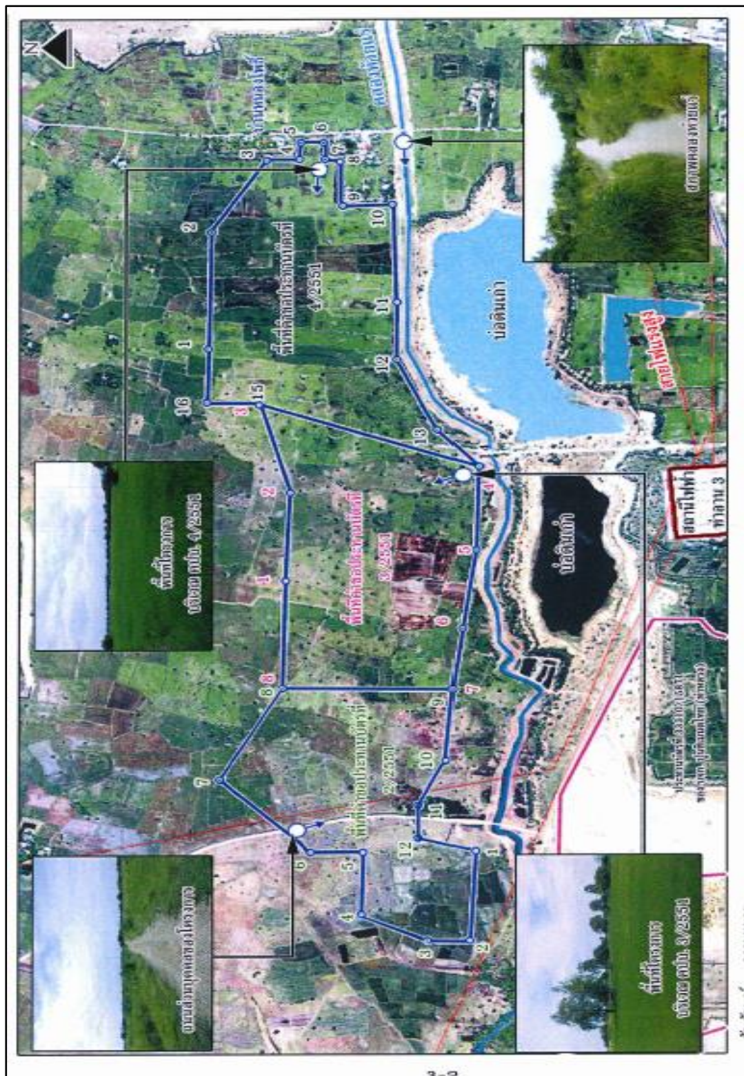
ภาพที่ 1.2 ลักษณะภูมิประเทศบริเวณโครงการ