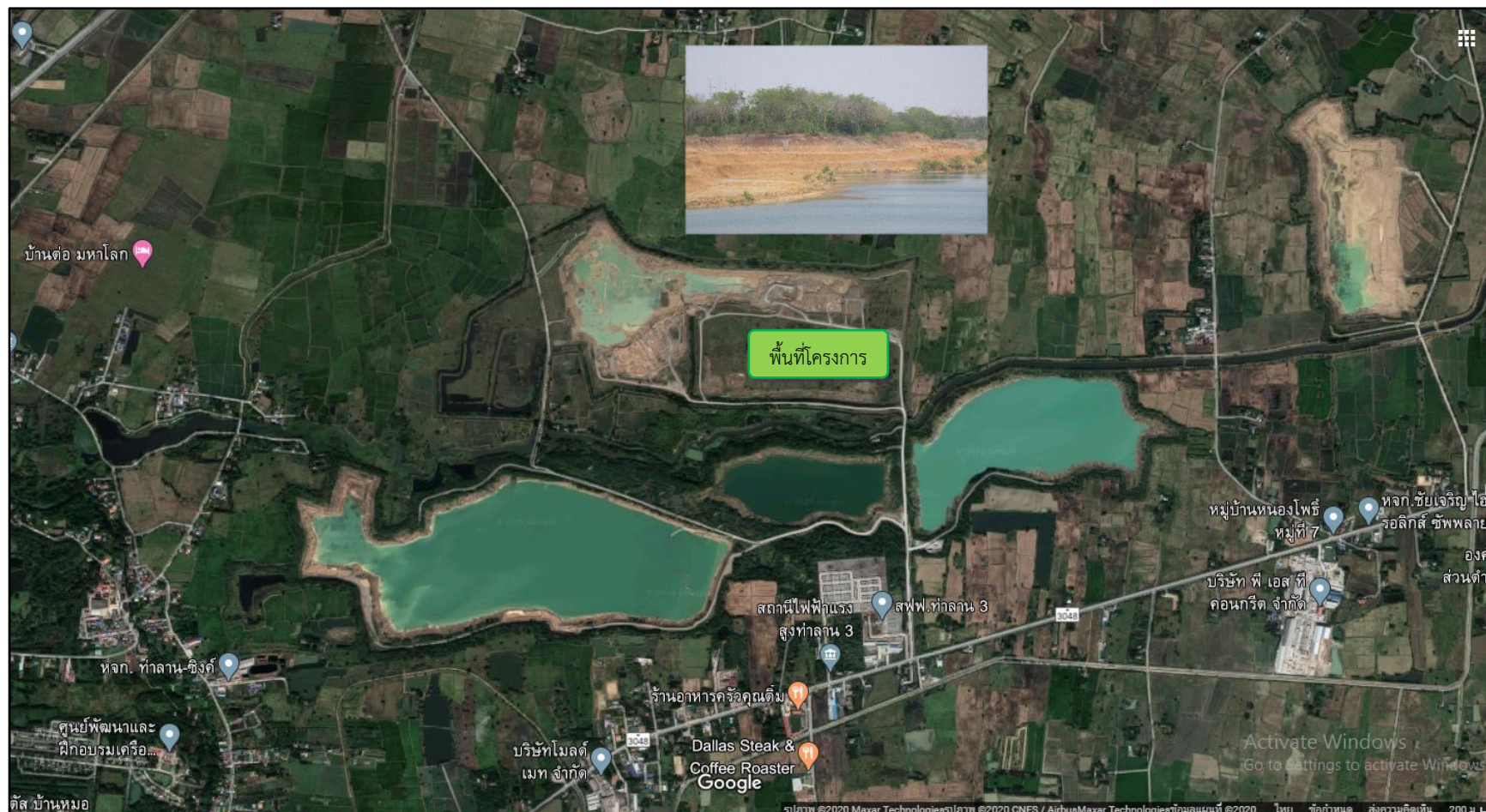
ภาพที่ 1.1 แผนที่ตั้งโครงการเหมืองแร่ดินอุตสาหกรรมชนิดดินซีเมนต์ ของบริษัทปูนซีเมนต์ไทย (ท่าหลวง) จำกัด